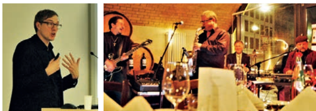
Eindrücke von der Jahrestagung 2017