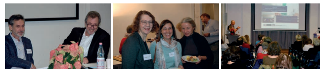
Eindrücke von der Jahrestagung 2019