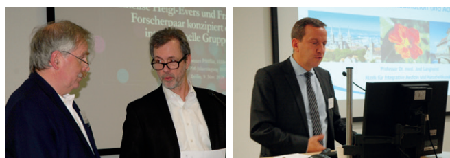
Eindrücke von der Jahrestagung 2019

Weitere Bilder finden Sie unter www.bpm-ev.de im Mitgliederbereich.