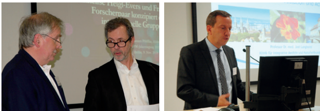
Eindrücke von der Jahrestagung 2019