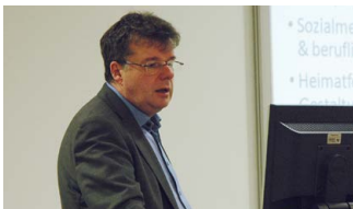
Eindrücke von der Jahrestagung 2016