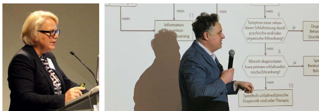
Eindrücke von der Jahrestagung 2018