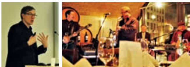
Eindrücke von der Jahrestagung 2017